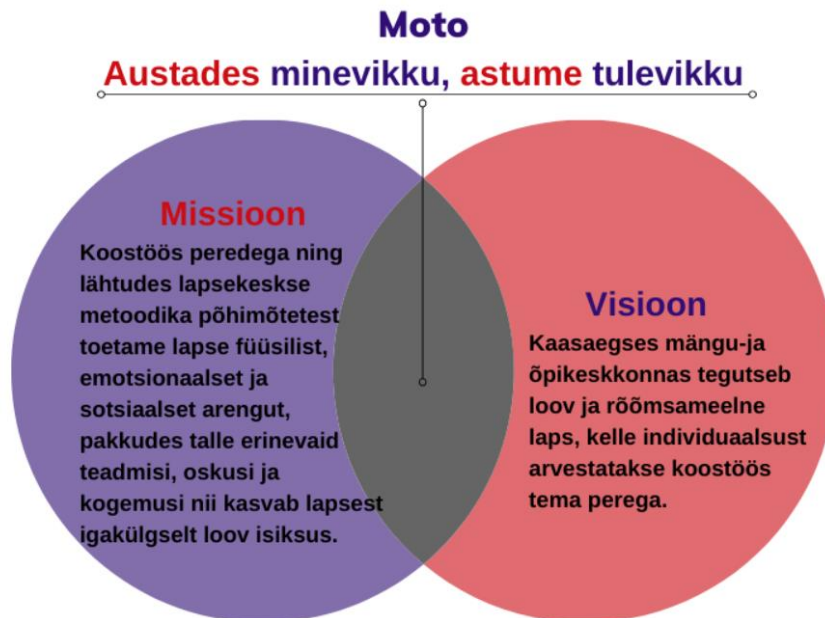
Joonis 2. Lasteasutuse missioon ja visioon